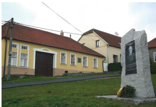
Dům s pamětní deskou generála Ludvíka Svobody