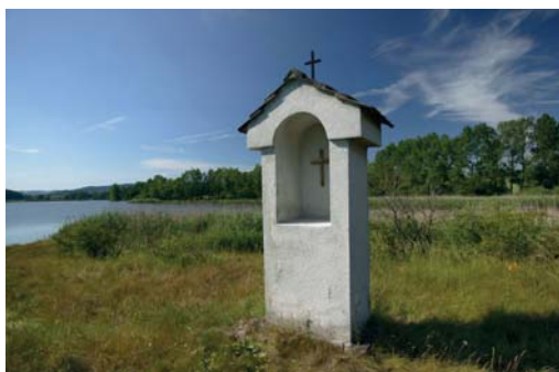
Boží muka u rybníku Velký Bor